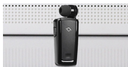
ttec - τα πάντα για τα κινητά