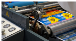
Αφίσες σε χρόνο Express