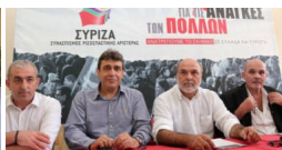
Και τώρα η ηγεσία του ΣΥΡΙΖΑ καλείται να λύσει τον...γόρδιο δεσμό