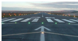
Νέο αεροδρόμιο Καστελίου - Το φθινόπωρο ή άναρξη...